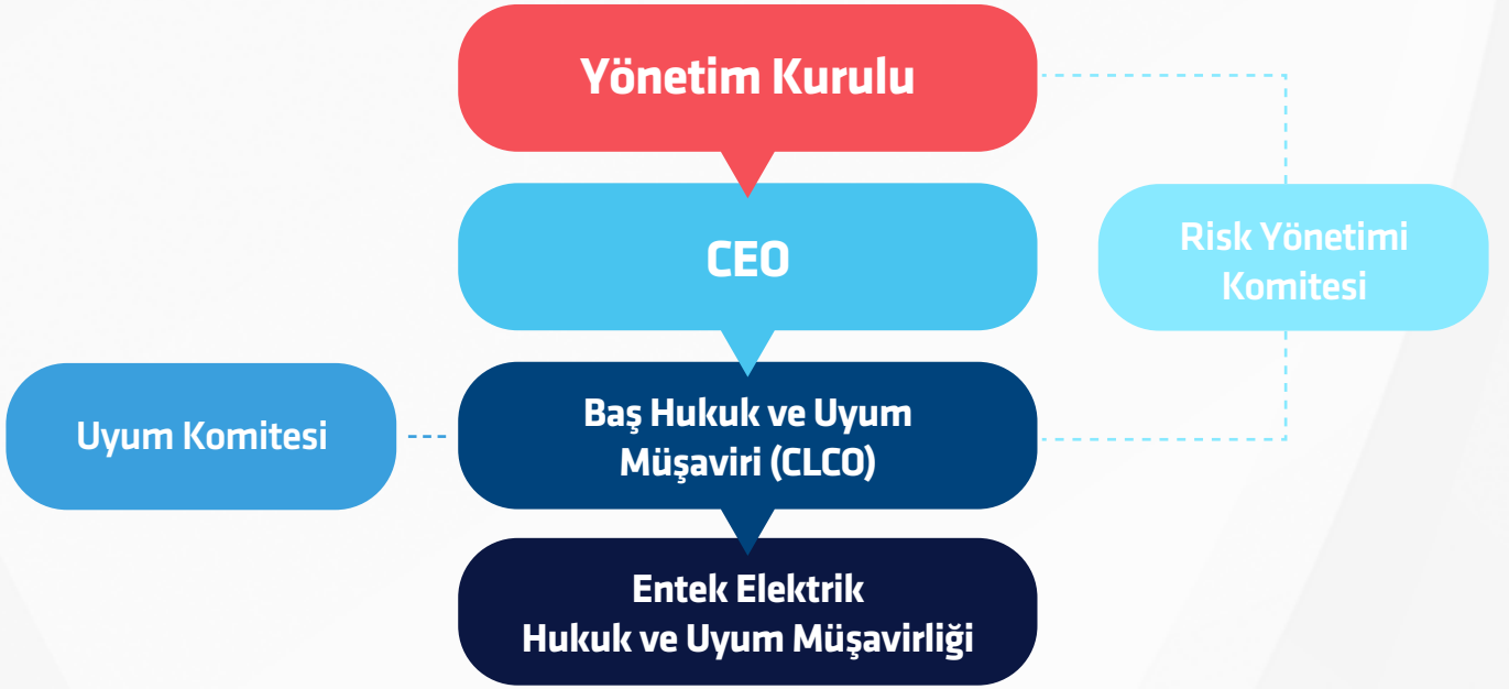
Şekil II: Entek Uyum Organizasyonu

Yukarıda görüldüğü gibi Uyum organizasyonun işlevleri: